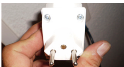
Entfernter Kontaktstift bei dreipoligem Stecker.