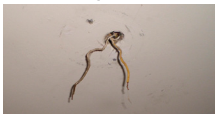
Nicht isolierte Drähte für den Anschluss von Deckenlampen.