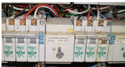
Oxidierter Sicherungsautomaten oder Sicherungen in Verteilerkästen.