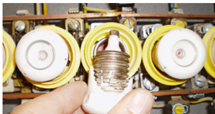
Beschädigter oder defekter Sicherungskopf.