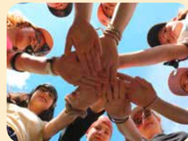
Der Blauring Windisch erhielt 1 000 Franken für das Sommerlager in Felsberg.

Es hat sich schon herumgesprochen: Die IBB engagiert sich für die Vereine der Region. Die Gönnerplattform nennt sich «iBooster – Wo Vereine Franken finden» und bedeutet, dass sich Vereine mit Ideen um einen schönen Batzen Geld für ihre Vereinskasse bewerben können. Die Plattform wurde letztes Jahr gestartet, und trotz Corona konnten in diesem Sommer einige Projekte umgesetzt werden, darunter die beiden Sommerlager von Blauring und Jungwacht Windisch sowie «die schnellstcht Bruggerin / de schnellstcht Bruggen». Impressionen, Bilder und Originalton von diesen iBooster-Siegerprojekten gibts online.