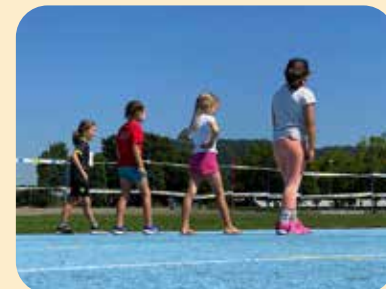
Die IBB unterstützte den Sprint-Anlass in Brugg mit 119 Teilnehmenden mit 5 000 Franken.