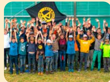
Für das Sommerlager in Valbella gab's 5 000 Franken für die Jungwacht Windisch.