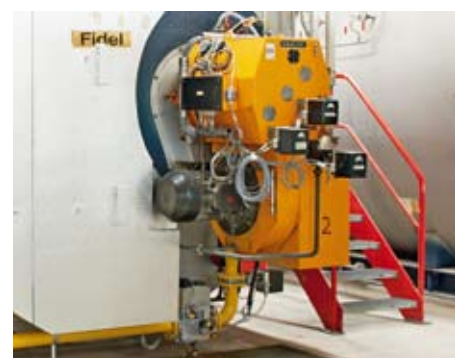
Brenner auf dem Dampfkessel «Fidel».

Mit einem Aufpreis kaufen IBB-Kundinnen und Kunden einen ökologischen Mehrwert, nämlich CO 2 -neutrale Energie in Form von Biogas. Eine offizielle, amtliche Clearingstelle garantiert, dass diese Menge an Biogas auch wirklich ins Erdgasnetz eingespeist wird.