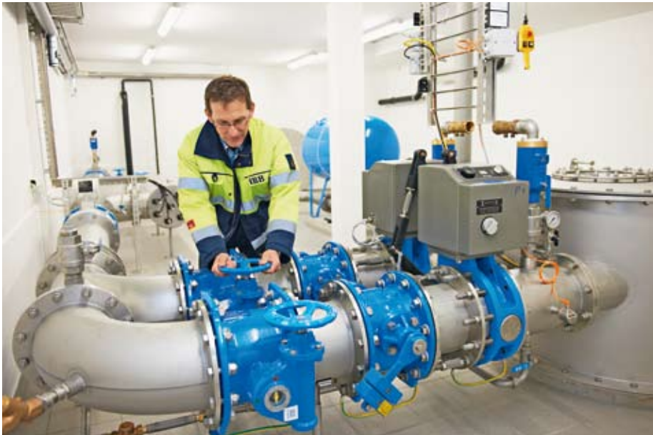
Der Brunnenmeister im Pumpenhaus Badschachen.

Das planmässig fertiggestellte Bauwerk stellt zusammen mit dem Grundwasserpumpwerk Vorhard und dem Quellwasserpumpwerk Brunnenmühle die langfristige und nachhaltige Trinkwasserversorgung der Stadt Brugg und der Partnergemeinden sicher.