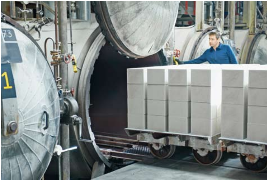
Bei der Firma HKS Hunziker AG werden Kalksandsteine in Autoklaven vier Stunden mit Dampf gehärtet.

Nachhaltigkeit und Schonung von Umwelt und Ressourcen werden im Hinblick auf Umweltprobleme wie etwa die Erderwärmung und gesundheitsschädigende Emissionen immer wichtiger. Erdgas und Biogas leisten dazu einen wertvollen Beitrag.