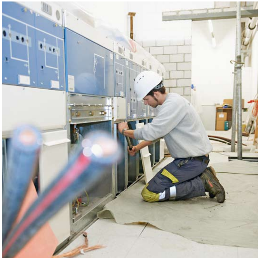
Kabelarbeiten an der Mittelspannungs-Schaltanlage.

und Datenleitungen sowie der hohen Sicherheit vor Naturkatastrophen gewählt. Das neue Datacenter Zürich-West wird Unternehmen eine hochsichere und hochverfügbare Umgebung zur Einrichtung eigener Rechenzentren bieten. Für KMU stehen Servereinschübe zur Verfügung. Das 143 Meter lange Gebäude besteht aus drei Trakten, die nacheinander gebaut werden und zusammen eine nutzbare Rechenzentrumsfläche von 10 000 Quadratmetern haben. Der erste Trakt wurde am 30. März 2011 feierlich eröffnet. Mit dem «greenTower» entsteht daneben in einer nächsten Bauetappe ein Bürogebäude mit rund 400 Arbeits- und Notfallarbeitsplätzen.